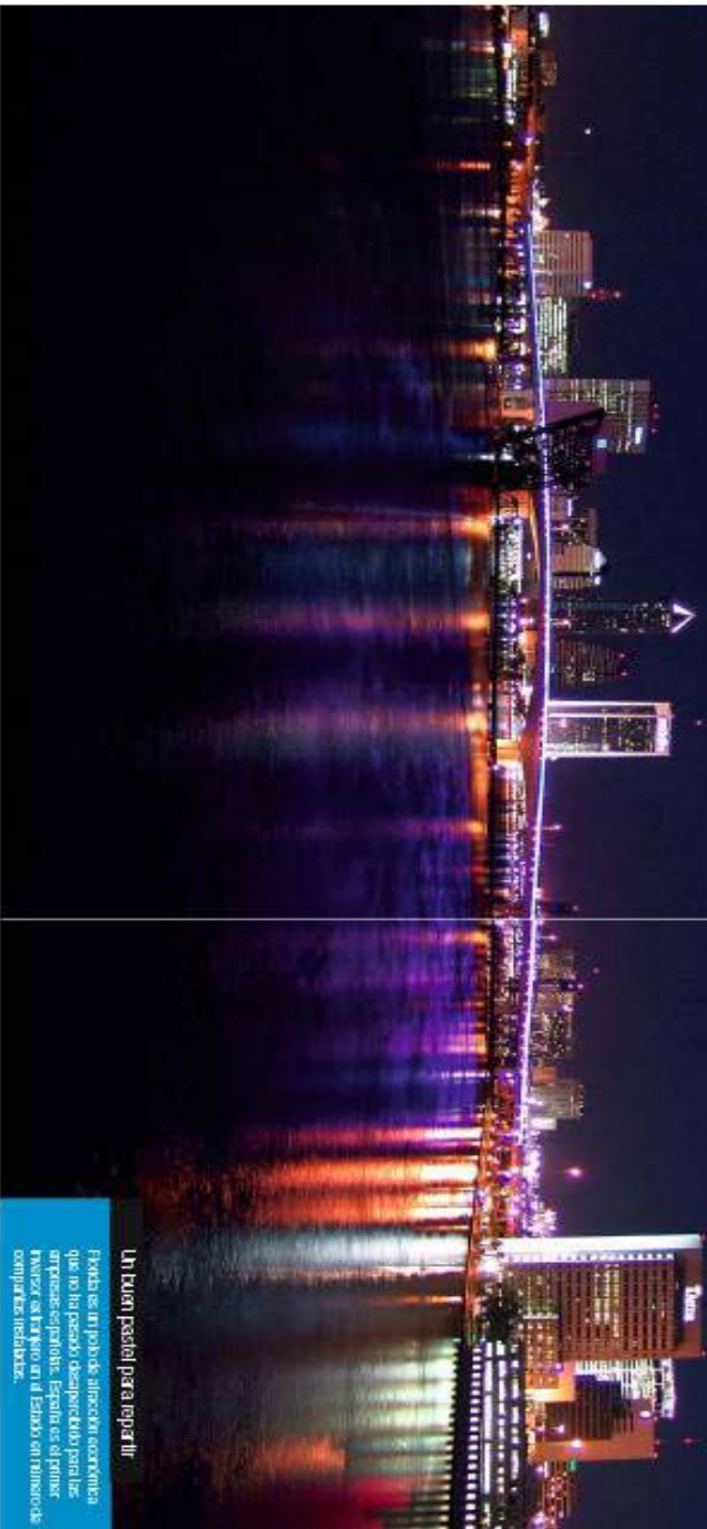
Un buen pasadillo para repetir. Facha es un polo de atracción económica que no ha pasado desapercibido para las empresas españolas. España es el primer inversor en el Estado en atención de compañías medibates.

Las compañías españolas avanzan posiciones en la decimosexta economía mundial, cuyo PIB crece a más del 7%. El Estado de Miami se consolida como la capital de los negocios de Latinoamérica. Y lo mejor está por venir: la zona necesita renovar infraestructuras y viviendas ante su constante aumento demográfico.